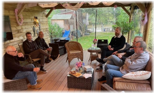
Fika i Fras "barn"