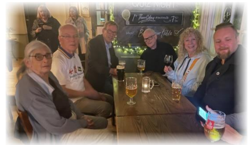
Trivsamt på The Swan