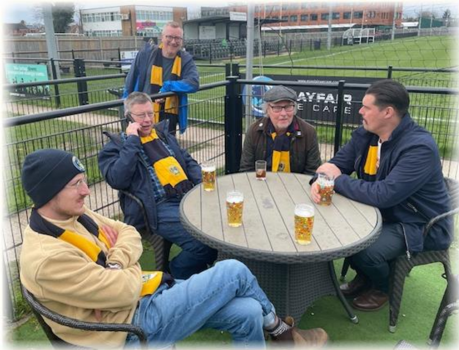
Uppladdning inför matchen