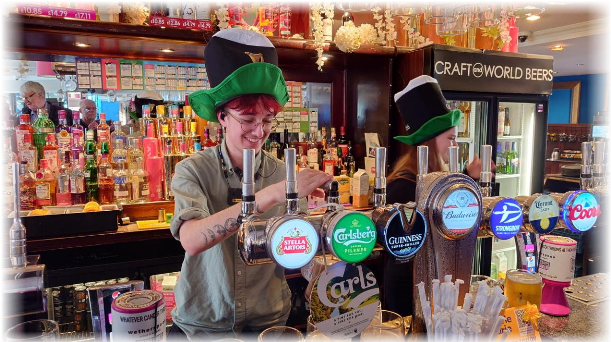
På söndagen var det St. Patrick's day och då var vi på The George