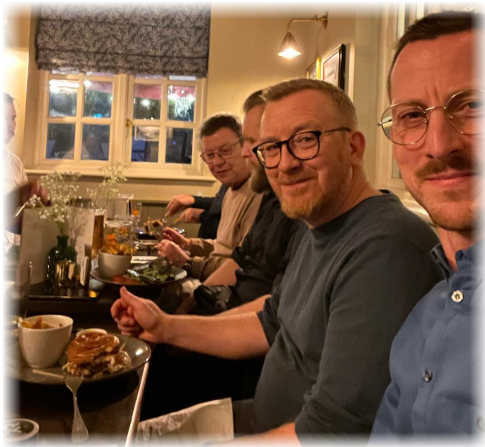
Torsdagsmiddagen intogs på The Bells