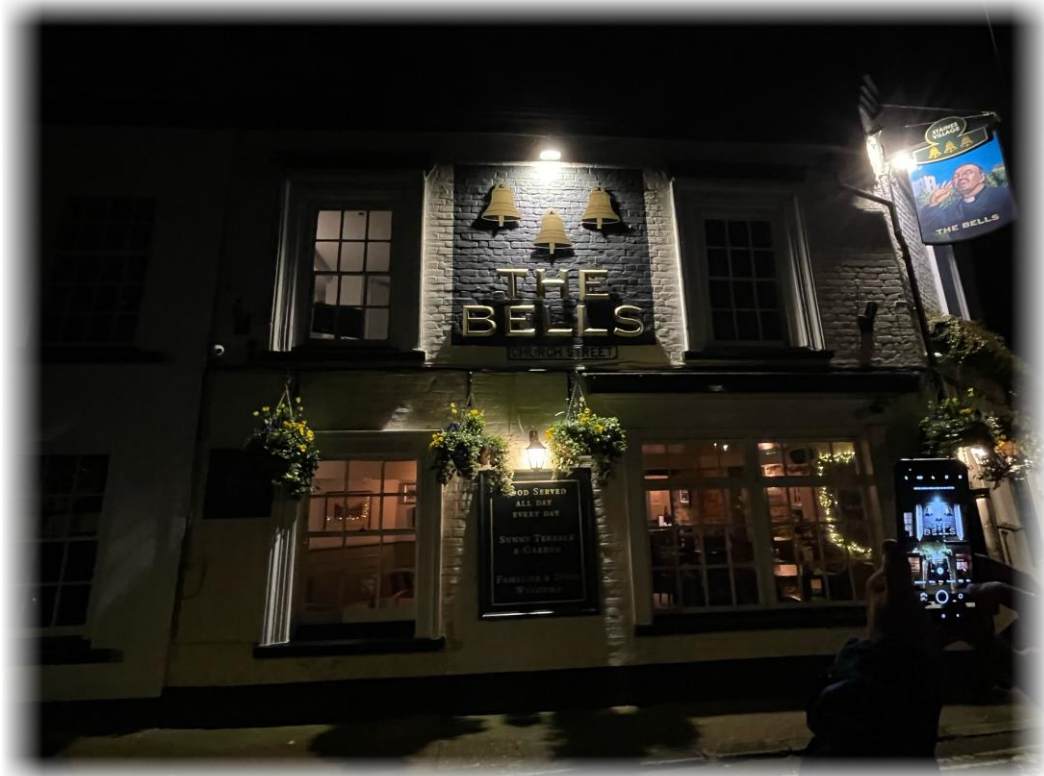
Vårt stamlokal i Staines – The Bells!