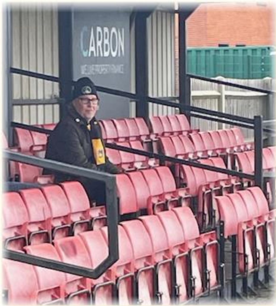
Pelle valde bortaläktaren